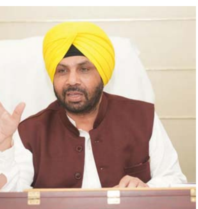
ਵੋਲਟੇਜ ਡਿਸਟ੍ਰੀਬਿਊਸ਼ਨ ਸਿਸਟਮ (ਐਚਵੀਡੀਐੱਸ) ਅਧੀਨ 2,83,349 ਨਵੇਂ ਡਿਸਟ੍ਰੀਬਿਊਸ਼ਨ ਟਰਾਂਸਫਾਰਮਰਾਂ ਦੀ ਸਥਾਪਨਾ ਦੇ ਨਾਲ 66 ਕੇਵੀ ਲਾਈਨਾਂ/ਭੂਮੀਗਤ ਕੇਬਲਾਂ ਦੇ 600 ਸਰਕਟ ਕਿਲੋਮੀਟਰ ਅਤੇ ਐਚ.ਟੀ./ਐਲ.ਟੀ. ਲਾਈਨਾਂ ਦੇ 1,10,117 ਸਰਕਟ ਕਿਲੋਮੀਟਰ ਬਣਾਏ ਜਾਣਗੇ। ਕੋਬਨਿਟ ਮੰਤਰੀ ਨੇ ਅੱਗੇ ਦੱਸਿਆ ਕਿ ਉਪਰੋਕਤ ਤੋਂ ਇਲਾਵਾ ਐੱਸ.ਸੀ.ਏ.ਡੀ.ਏ. (ਸੁਪਰਵਾਇਜ਼ਰੀ ਕੇਂਟਰਲ ਐਂਡ ਡਾਟਾ ਐਕੂਜਿਸ਼ਨ) ਅਤੇ ਓ.ਐਮ.ਐੱਸ. (ਆਊਟੋਜ ਮੋਨੀਟਰਿੰਗ ਸਿਸਟਮ), ਕਸਟਮਰ ਕੇਅਰ ਸੈਂਟਰ, ਯੂਨੀਫਾਈਡ ਬਿਲਿੰਗ ਸਲਿਊਸ਼ਨ ਵਰਗੇ ਆਈ.ਟੀ. ਆਧਾਰਤ ਕੰਮ ਵੀ ਕੀਤੇ ਜਾਣਗੇ। ਜ਼ਿਕਰਯੋਗ ਹੈ ਕਿ ਇਨ੍ਹਾਂ ਸਾਰੇ ਕੰਮਾਂ ਦੇ ਅਮਲ ਵਿੱਚ ਆਉਣ ਨਾਲ ਨੁਕਸਾਨ ਘਟਣ ਤੋਂ ਇਲਾਵਾ ਸੂਬੇ ਵਿੱਚ ਬਿਜਲੀ ਸਪਲਾਈ ਦੀ ਭਰੋਸੇਯੋਗਤਾ ਅਤੇ ਗੁਣਵੱਤਾ ਵਿੱਚ ਹੋਰ ਸੁਧਾਰ ਹੋਵੇਗਾ ਜਿਸ ਨਾਲ ਸੂਬੇ ਦੇ ਇੱਕ ਕਰੋੜ ਤੋਂ ਵੱਧ ਬਿਜਲੀ ਖਪਤਕਾਰਾਂ ਨੂੰ ਲਾਭ ਹੋਵੇਗਾ। ਭਾਰਤ ਸਰਕਾਰ ਵੱਲੋਂ ਇਸ ਸਕੀਮ ਅਧੀਨ ਕੁੱਲ ਬਜਟ ਸਹਾਇਤਾ ਵਜੋਂ ਕੁੱਲ 25237 ਕਰੋੜ ਰੁਪਏ ਦੀ ਪੂੰਜੀਕਰ ਰਾਸ਼ੀ ਵਿੱਚੋਂ 11632 ਕਰੋੜ ਰੁਪਏ ਦੀ ਗ੍ਰਾਂਟ ਮੁਹੱਈਆ ਕਰਵਾਈ ਜਾਵੇਗੀ।

ਚੰਡੀਗੜ੍ਹ (ਪੰਜਾਬੀ ਅਖਬਾਰ ਬਿਊਰੋ)- 24 ਘੰਟੇ ਮਿਆਰੀ ਬਿਜਲੀ ਸਪਲਾਈ ਦੇਣ ਦੇ ਉਦੇਸ਼ ਨਾਲ ਪੰਜਾਬ ਸਰਕਾਰ ਨੇ 25,237 ਕਰੋੜ ਰੁਪਏ ਦੀ ਕਾਰਜ ਯੋਜਨਾ ਨੂੰ ਪ੍ਰਵਾਨਗੀ ਦੇ ਦਿੱਤੀ ਗਈ ਹੈ ਤਾਂ ਜੋ ਖਪਤਕਾਰਾਂ ਨੂੰ ਬਿਜਲੀ ਦੀ ਸਪਲਾਈ ਵਿੱਚ ਹੋਰ ਸੁਧਾਰ ਲਿਆਂਦਾ ਜਾ ਸਕੇ। ਰਿਵਾਰ-ਬੋਸਤ ਐਂਡ ਰਿਜ਼ਲਟ-ਲਿੰਕਡ ਗੀਵੇਪਡ ਡਿਸਟ੍ਰੀਬਿਊਸ਼ਨ ਸੈਕਟਰ ਸਕੀਮ (ਆਰਡੀਐੱਸਐੱਸ) ਇੱਕ ਫਲੈਗਸ਼ਿਪ ਸਕੀਮ ਹੈ ਜਿਸਦਾ ਉਦੇਸ਼ ਇੱਕ ਮਜ਼ਬੂਤ ਅਤੇ ਟਿਕਾਊ ਵੱਡੇ ਨੈੱਟਵਰਕ ਰਾਹੀਂ ਡਿਸਟ੍ਰੀਬਿਊਸ਼ਨ ਕੈਪਨੀਆਂ ਦੀ ਕਾਰਜ-ਕੁਸ਼ਲਤਾ ਅਤੇ ਵਿੱਤੀ ਸਥਿਰਤਾ ਵਿੱਚ ਸੁਧਾਰ ਕਰਨਾ ਹੈ। ਇਸ ਸਬੰਧੀ ਜਾਣਕਾਰੀ ਦਿੰਦਿਆਂ ਬਿਜਲੀ ਮੰਤਰੀ ਹਰਭਜਨ ਸਿੰਘ ਈ.ਟੀ.ਓ ਨੇ ਦੱਸਿਆ ਕਿ ਇਸ ਸਕੀਮ ਤਹਿਤ 94 ਨਵੇਂ 66 ਕੇਵੀ ਸਬ ਸਟੇਸ਼ਨਾਂ ਨੂੰ ਕਾਰਜਸ਼ੀਲ ਕਰਨ ਅਤੇ ਕੁਮਵਾਰ 89 ਅਤੇ 382 66/11 ਕੇਵੀ ਪਾਵਰ ਟਰਾਂਸਫਾਰਮਰਾਂ ਦੀ ਸਥਾਪਨਾ ਅਤੇ ਵਿਰਾਸਤ ਵਿੱਚ ਵਾਧੇ ਵਰਗੇ ਬੁਨਿਆਦੀ ਢਾਂਚੇ ਦੇ ਕੰਮ ਕੀਤੇ ਜਾਣਗੇ। ਉਨ੍ਹਾਂ ਦੱਸਿਆ ਕਿ ਇਸ ਯੋਜਨਾ ਤਹਿਤ ਸਿਸਟਮ ਦੀ ਮਜ਼ਬੂਤੀ ਅਤੇ ਇਸ ਦੇ ਆਧੁਨਿਕੀਕਰਨ ਲਈ 66 ਕੇਵੀ ਟਰਾਂਸਮਿਸ਼ਨ ਲਾਈਨਾਂ