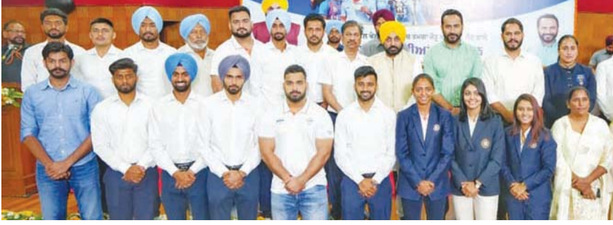
ਵਿਸ਼ਵ ਪੱਧਰ 'ਤੇ ਮੁਕਾਬਲਾ ਕਰਨ ਲਈ ਖੇਡਾਂ ਦੇ ਬੁਨਿਆਦੀ ਢਾਂਚੇ ਦੀ ਸਖਤ ਲੋੜ ਦਾ ਜ਼ਿਕਰ ਕਰਦੇ ਹੋਏ ਮੁੱਖ ਮੰਤਰੀ ਨੇ ਕਿਹਾ ਕਿ ਸਾਨੂੰ ਖੇਡਾਂ ਵਿੱਚ ਵਧੀਆ ਪ੍ਰਦਰਸ਼ਨ ਕਰਨ ਦੀ ਪ੍ਰਤਿਭਾ ਕੁਦਰਤੀ ਤੌਰ ਉੱਤੇ ਵਿਰਾਸਤ ਵਿੱਚ ਮਿਲੀ ਹੈ ਅਤੇ ਜੇਕਰ ਮੌਕਾ ਦਿੱਤਾ ਗਿਆ ਤਾਂ ਇਹ ਖਿਡਾਰੀ ਪੂਰੀ ਦੁਨੀਆ ਵਿੱਚ ਹਿੱਸ

ਚੰਡੀਗੜ੍ਹ (ਪੰਜਾਬੀ ਅਖਬਾਰ ਬਿਊਰੋ)- ਪੰਜਾਬ ਦੇ ਮੁੱਖ ਮੰਤਰੀ ਭਗਵੰਤ ਮਾਨ ਨੇ ਬਰਮਿੰਘਮ ਵਿਖੇ ਹਾਲ ਦੀ ਵਿੱਚ ਹੋਈਆਂ ਗਸਟਰਮੈਂਡਲ ਖੇਡਾਂ ਵਿੱਚ ਹਿੱਸਾ ਲੈਣ ਵਾਲੇ ਪੰਜਾਬ ਦੇ 23 ਖਿਡਾਰੀਆਂ ਦਾ 9.30 ਕਰੋੜ ਰੁਪਏ ਦੇ ਨਗਦ ਇਨਾਮ ਨਾਲ ਸਨਮਾਨ ਕੀਤਾ। ਮੁੱਖ ਮੰਤਰੀ ਦੀ ਇਸ ਪਹਿਲਕਦਮੀ ਨਾਲ ਪੰਜਾਬ, ਬਰਮਿੰਘਮ ਗਸਟਰਮੈਂਡਲ ਖੇਡਾਂ ਦੇ ਖਿਡਾਰੀਆਂ ਦਾ ਸਨਮਾਨ ਕਰਨ ਵਾਲਾ ਦੇਸ਼ ਦਾ ਪਹਿਲਾ ਸੂਬਾ ਬਣ ਗਿਆ ਹੈ। ਇੱਥੇ ਮਿਊਜ਼ਿਅਮ ਭਵਨ ਵਿਖੇ ਇਕੱਠੇ ਨੂੰ ਸੰਬੋਧਨ ਕਰਦੇ ਹੋਏ ਮੁੱਖ ਮੰਤਰੀ ਨੇ ਕਿਹਾ, "ਇਹ ਸਾਡੀ ਸਰਕਾਰ ਵੱਲੋਂ ਦੇਸ਼ ਦਾ ਨਾਮ ਰੋਸ਼ਨ ਕਰਨ ਲਈ ਤੁਹਾਡੇ ਵੱਲੋਂ ਕੀਤੀ ਗਈ ਕਰਤੀ ਮਿਹਨਤ ਦੇ ਸਤਿਕਾਰ ਵਿੱਚ ਇਕ ਨਿਮਾਣਾ ਜਿਹਾ